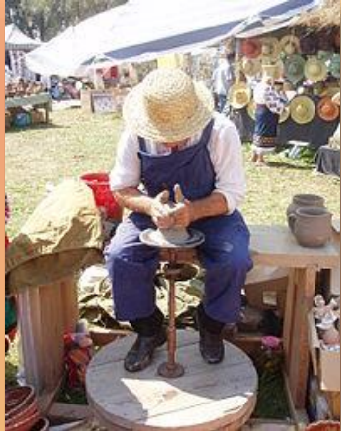
Сучасний гончар, Сорочинський ярмарок ,Полтавська обл. 2008 р.