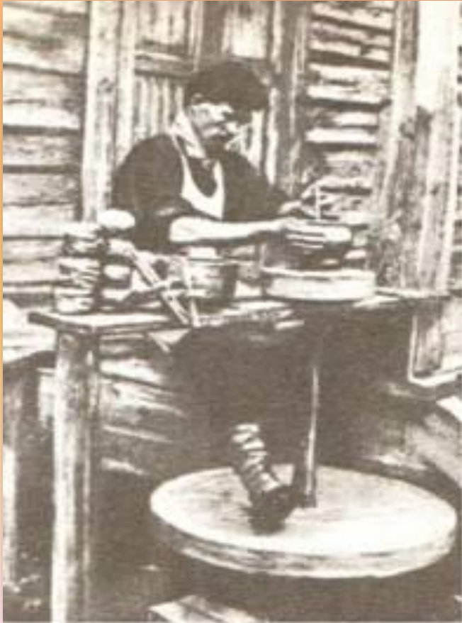
Перший український гончар, фото 2-ї пол. XIX ст.